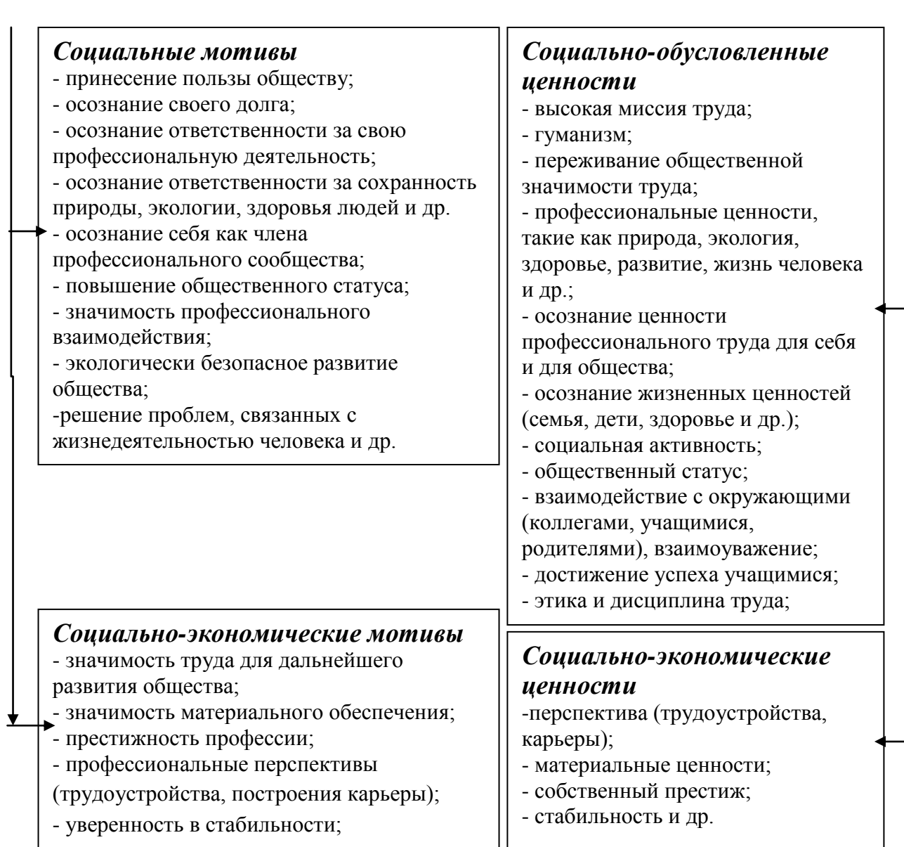
Рисунок 1. Модель мотивационно-ценностной направленности на профессиональную деятельность студентов естественно-географических специальностей

В главе 3 «Эмпирическое исследование динамики мотивационно-ценностной направленности студентов разных специальностей на профессиональную деятельность», представлена программа организации изучения динамики мотивационно-ценностной направленности студентов, излагаются результаты исследований, описываются особенности изменения