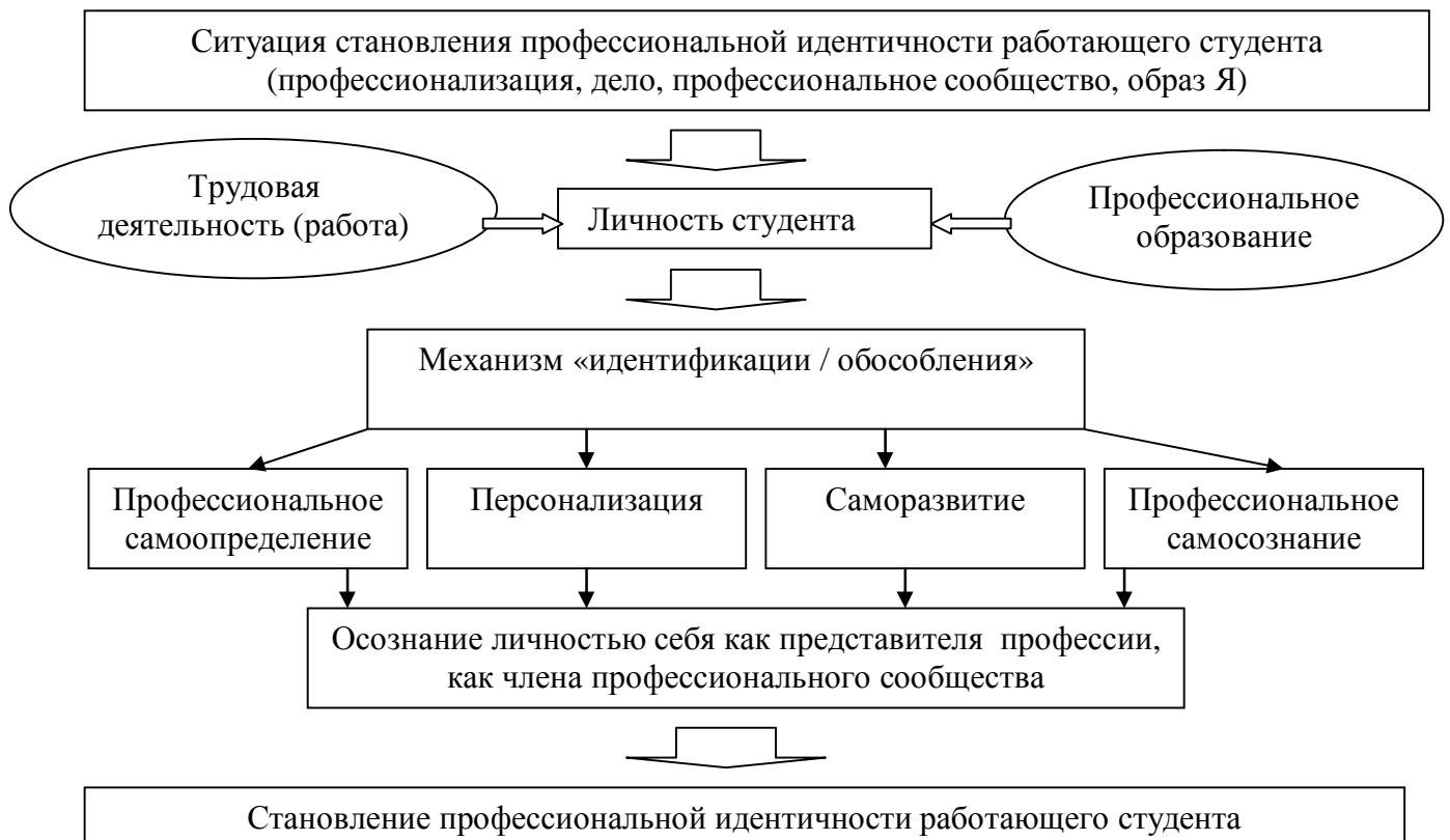
Рис.1. Становление профессиональной идентичности работающего студента.

самосознания и самоотношения как аспектов проблемы Я. Развитие личности в деятельности и становление её профессиональной идентичности происходит через механизм идентификации и обособления. Идентификация представляет собой процесс эмоционального и иного самоутверждения человека с другим человеком, группой, образцом, а обособление помогает сохранению своей уникальной индивидуальности, в основе которой лежат потребности в развитии и росте, в свободе и познании себя. Становление профессиональной идентичности рассматривается в рамках профессионального самоопределения, развития, ответственности за профессиональные действия и отношения. Теоретический анализ основных подходов к изучению становления профессиональной идентичности в психологии применительно к ситуации профессионализации студентов позволил наглядно отобразить её в схеме (см. рис. 1).