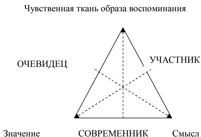
Рис.4. Психологические позиции Участника, Свидетеля и Современника относительно исторического опыта.

исторического компонента индивидуальной АП в контексте трех образующих сознания по А.Н. Леонтьеву (рис.2). Излагаются результаты пяти эмпирических исследований. Первое (N = 408) направлено на выявление представленности механизмов спонтанного включения исторического компонента, спонтанно включаемого в АП, определение преобладающей среди современных россиян позиции относительно исторических событий, анализ возрастных особенностей историчности АП. в зависимости от возраста. Во втором исследовании (N = 90) определялась взаимосвязь историчности АП и личностных характеристик. В третьем (N = 68) изучалась готовность испытуемых осваивать исторический опыт с различных психологических позиций. В четвертом проводился анализ культурной специфичности исторической памяти россиян по сравнению с представителями восьми других культур (N = 25). В пятом представлена процедура разработки опросника, выявляющего профиль направленности патриотизма (N = 144) и исследована взаимосвязь уровня патриотизма и степени историчности АП (N = 108).